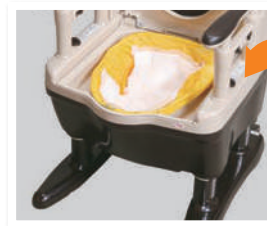
処理袋をバケツに被せる