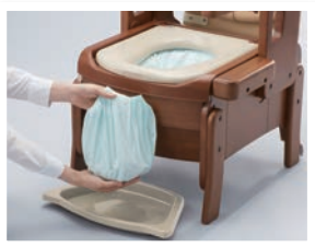
固めて自動ラップする