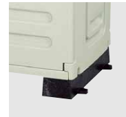
固定台 (アンカー固定で 風対策や盗難防止に)