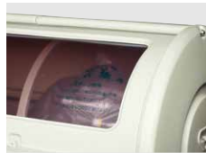
中身が見える透明ふた