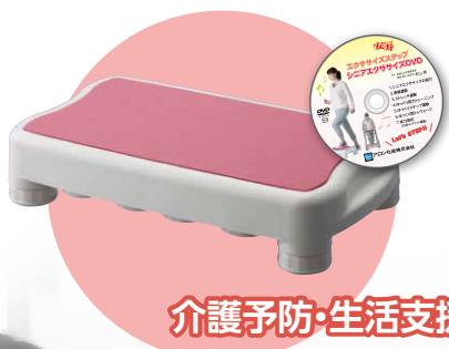
介護予防・生活支援