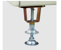
アジャスター (段差がある場所への 設置に)