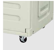
キャスター (移動する場合に)