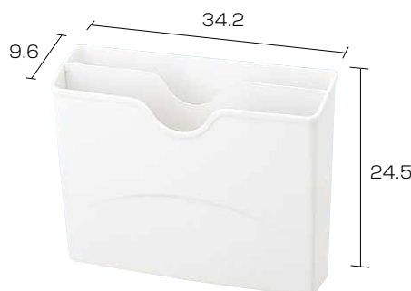
分別ポケット 仕切板 (オプション)