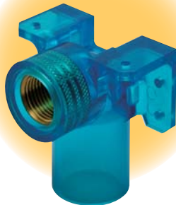
座付給水検用 エルボ(A形)