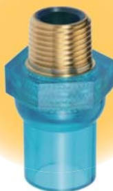
金属おねじ付バルブ用 ソケット(1型)