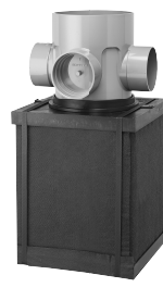
狭小地への設置に最適! 貯留量40ℓ PM-box 30D