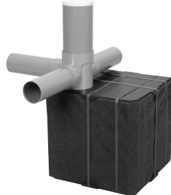
大容量タイプ! 貯留量139ℓ PM-box