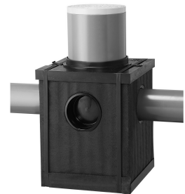
浅埋設と省スペースを実現! 貯留量20ℓ PM-box 30S