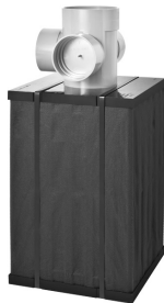
大容量タイプ! 貯留量154ℓ PM-box 50DX750H